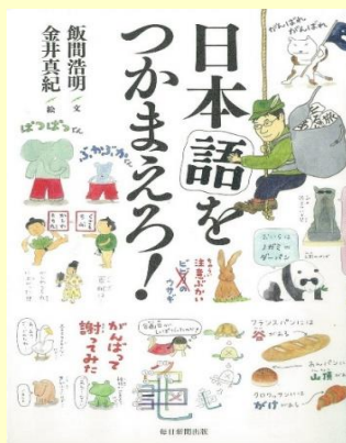
飯間 浩明／著 毎日新聞出版／出版