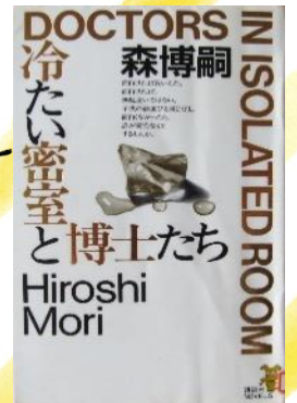
冷たい密室と博士たち 森 博嗣／著 講談社／発行

夏の必需品「こおり」はどうやってできるのか、どんな性質を持っているのか。かわいいイラストやおうちでできる実験でその謎に迫ります。