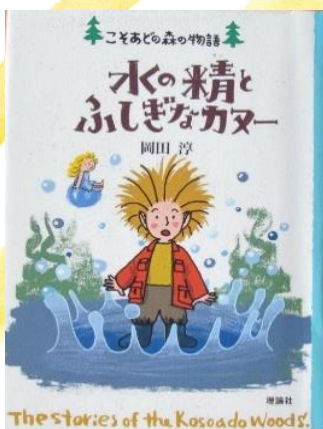
こそあどの森の物語 水の精とふしぎなカヌー 岡田 淳／著 理論社／発行

さまざまな洞窟をナショナルジオグラフィックの最新技術で撮影! 地下や海の中に広がる別世界を堪能できます。