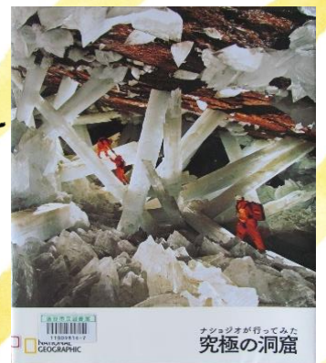
ナショナルジオグラフィック 究極の洞窟 ナショナルジオグラフィック／編 日経ナショナルジオグラフィック社／発行

こそあどの森のちょっと変わった住人たちの物語。小さな泉の妖精の奮闘 & 川の源流を目指す冒険、読んでいると水の音が聞こえてくるはず!